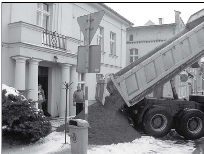
Remont w muzeum – przybył transport betonu.