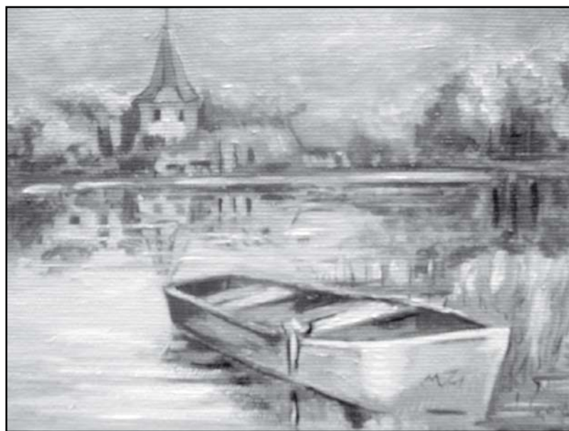
Obraz olejny Małgorzaty Zgoły „Latem”

których mowa wyżej, remont sali muzealnej przeciągnie się. Planowane zakończenie miało nastąpić z początkiem marca, lecz obecnie szacuje się, iż prace mogą potrwać nawet o miesiąc dłużej. W trakcie remontu, prócz wymiany podłogi, modernizacji podlegać będą także ściany i sufit sali. Zostaną one pokryte wytrzymałą płytą, która zastąpi dawny zniszczony tynk. Sala otrzyma także nowe oświetlenie elektryczne. Wszystkie działania podniosą standard oferowanych przez muzeum warunków ekspozycyjnych; należy mieć nadzieję, że w możliwie najszybszym czasie podobnego remontu doczekają się pozostałe pomieszczenia ekspozycyjne międzychodzkiego muzeum (dla przypomnienia: w 2003 r. budynek muzealny otrzymał nowe poszycie dachowe, w latach 2004-2005 wyremontowano pomieszczenia Czytelni Regionalnej i gabinetu, a w 2006 r. wymieniono tynki elewacji oraz stolarkę okienną).