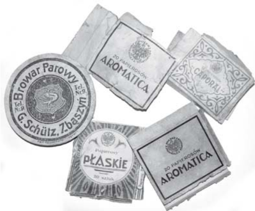
Zabytki z pod muzealnej podłogi

W upływającym miesiącu Muzeum Regionalne przerwało działalność wystawienniczą w związku z remontem dużej sali wystaw czasowych, mieszczącej się na parterze. Długie lata intensywnego użytkowania pomieszczenia doprowadziły do znacznego zużycia ścian, sufitu i zwłaszcza podłogi, która po 37 latach zostanie zastąpiona nową. Będzie to, podobnie jak dotąd, tzw. „deska barlińska”. Podczas remontu okazało się, że nieodzowne jest wykonanie posadzki betonowej pod nową podłogę, zatem trzeba było całkowicie usunąć dawną drewnianą konstrukcję wraz z legarami i powstałą „jamę” wypełnić żwirami, stanowiącym podsypkę pod betonową wylewkę. Podczas tych prac doszło do ciekawych odkryć z „pogranicza archeologii”. Pracownicy z firmy Ryszarda Szpotkowskiego, przeprowadzającej remont wspólnie z zakładem p. Hanyżkiewicza, odkryli w rumowisku na miejscu demontowanej podłogi ciekawe i rzadko spotykane zabytki. Nie są one związane bezpośrednio z historią naszego miasta, ale z uwagi na swą specyfikę i rzadkość występowania zasługują na wspomnienie. Niecodzienne znaleziska to: podkładka pod kufel piwny z reklamą browaru parowego