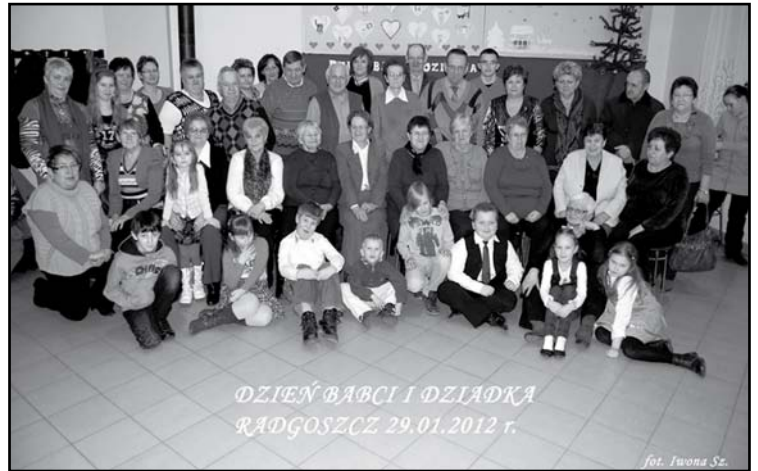
DZIEŃ BABCI I DZIADKA RADGOSZCZ 29.01.2012 r.

Na zakończenie programu dzieci obdarowały wszystkich gości upominkami własnoręcznie wykonanymi podczas zajęć świetlicowych. Potem zrobiło się gwarno przy wspólnym stole. Kawa, herbatka, przepyszne placki upieczone przez matki aktywistki. Ale to nie był ostatni punkt imprezy.